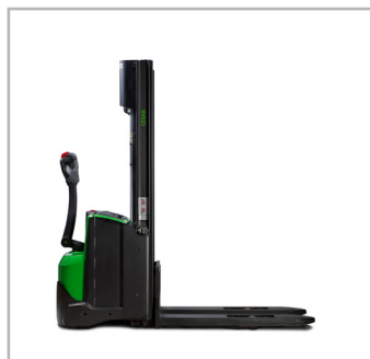
CESAB S210-214, S208L-214L, S220D