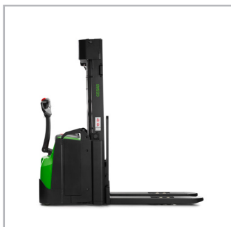
CESAB S215-220, S215L-220L